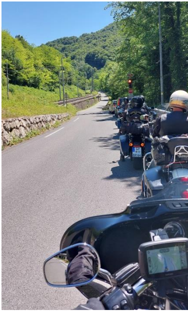
Hrastnik – wieder eine Ampel, da die Straßen teils sehr schmal gewesen sind.