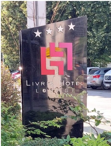
Dietmar hat uns super durch diesen hektischen Stadtverkehr zum Hotel geführt