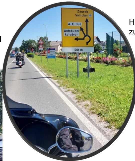
Hier war es noch angenehm zu fahren aber später sind wir in den Feierabendverkehr auf der City-Schnellstraße geraten