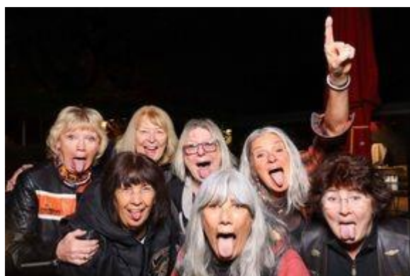
Die Einstainer Mädels