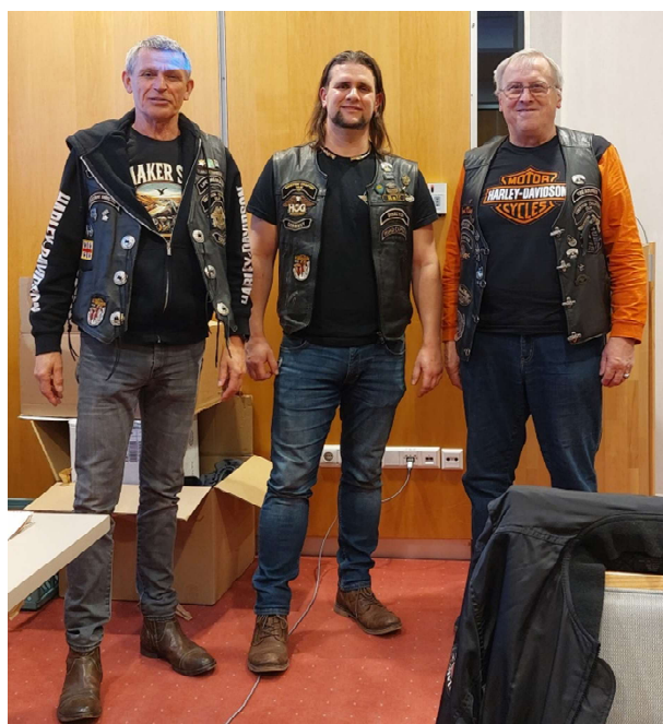
der alte und neuer Vorstand