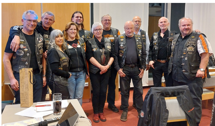
das alte und neue Vorstandsteam