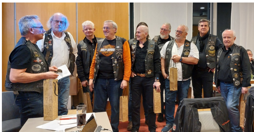
ein Dankeschön vom HRC an die Road Captains