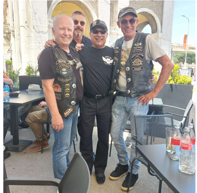
Man trifft auch das Munich-Chapter und andere