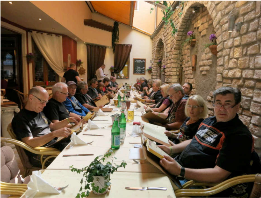
Alle Jahre wieder: Gemeinsames Abendessen am Samstag in der Pizzeria "Da Toni".