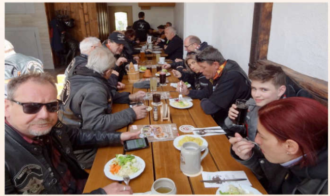
Wir sind schon bedient!