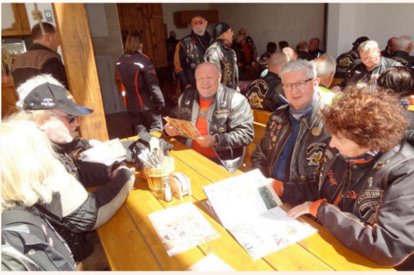
Was essen wir denn heute???